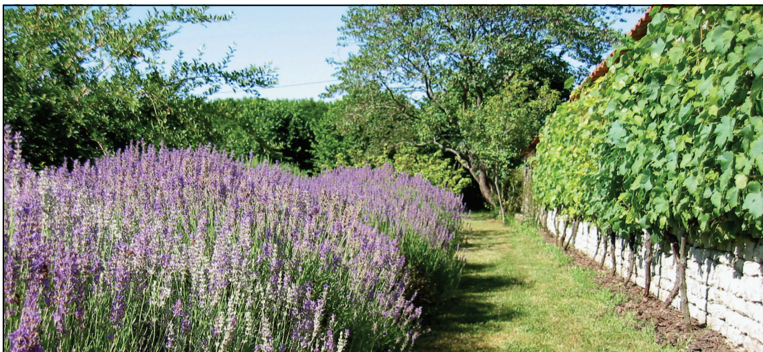
Lavande de notre jardin